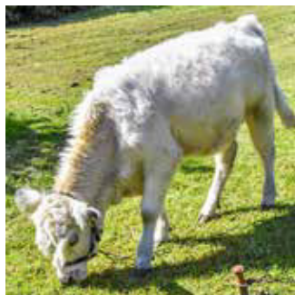
Kälbchen Elza wurde mit der Flasche aufgezogen und ist dadurch sehr zutraulich.