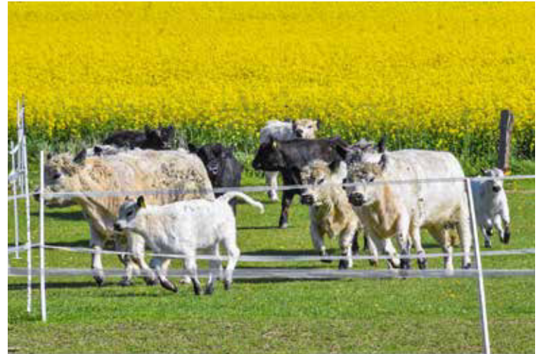
Im Galopp über die Koppel: Die White-Galloway-Rinder werden in Richtung Stall getrieben, damit die Besucher sie aus der Nähe betrachten können.