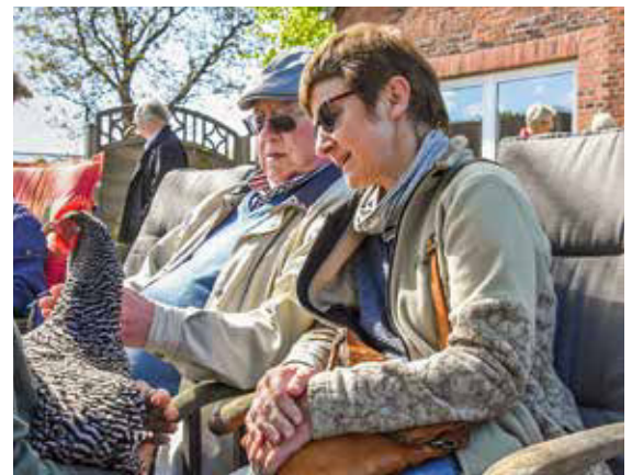
Anfassen ausdrücklich erwünscht: Tiere streicheln beruhigt nicht nur, es weckt auch Erinnerungen an die eigene Zeit mit Haustieren oder die Jahre auf dem eigenen Hof. Und immer zaubern die Tiere ein Lächeln in das Gesicht der Besucher.